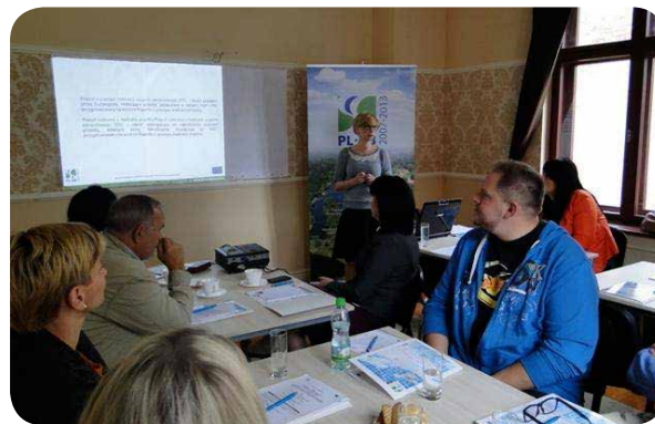
Zdjęcie: Szkolenie w dniu 24.06.2014 r. w siedzibie WST w Zielonej Górze.