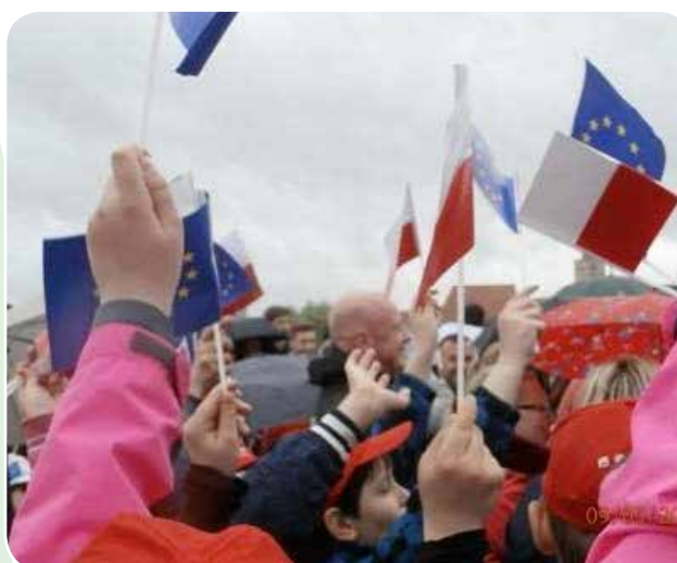
Zdjęcia: Dzień Europy w Dwumieście Frankfurt nad Odrą-Słubice