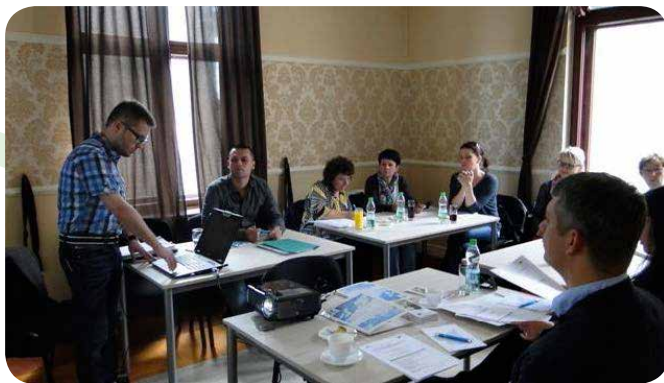
Zdjęcie: Szkolenie w dniu 23.06.2014 r. w siedzibie WST w Zielonej Górze.

Podczas obu spotkań uczestnicy mieli możliwość aktywnego udziału oraz zgłaszania własnych propozycji tematów szkoleń organizowanych w przyszłości przez WST. Wychodząc beneficjentom naprzeciw WST planuje przygotowanie szkoleń z udziałem ekspertów zewnętrznych m.in. na temat nieprawidłowości w zakresie składania zamówień publicznych i procedury ich rozliczenia w ramach Programu. Przewidywany termin realizacji szkolenia to druga połowa 2014 r.