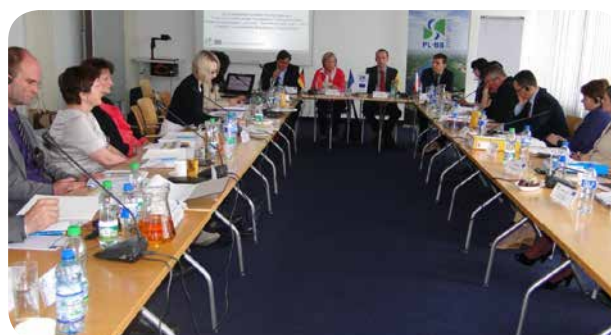
Zdjęcia: Posiedzenie Komitetu Monitorującego w dniu 15 maja 2014 r. we Frankfurcie nad Odrą

Wykres poniżej przedstawia stosunek aktualnie zakontraktowanych środków z EFRR do środków pierwotnie zaplanowanych dla poszczególnych priorytetów (1–3) w Programie.